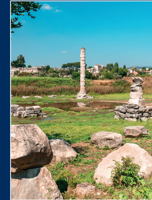
Artemis Tapınağı: Antik Dünyanın Harikalarından Biri

Efes'in hem ilk hem de son yerleşim yeri olan Ayasuluk'taki en dikkat çekici yapı olan St. Jean Anıt Müzesi, Efes'in Hristiyanlarca bir hac merkezi olarak kabul edilmesinin bir diğer nedeni. Hz. İsa'nın havarilerinden olan, hayatının son yıllarını Efes'te geçiren ve İncil'i de burada yazan Aziz Yahya Ayasuluk'a gömülmeyi vasiyet etmiş; mezarının bulunduğu yere de Bizans Dönemi'nde birden çok kilise inşa edilmiştir. Bizans İmparatoru Justinianus ve eşi Theodora tarafından MS 6. yüzyılda inşa edilmiş olan kilise, dönemin görkemli eserlerinden biriydi.