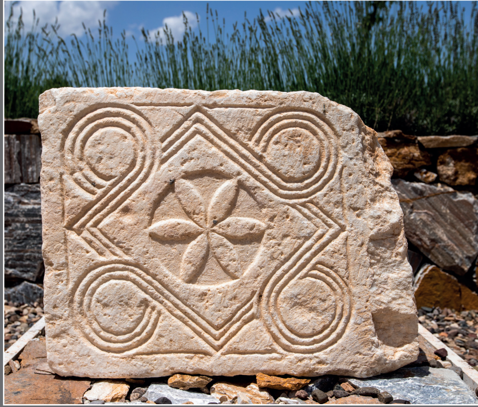
"Kızılırmak Kavisi içerisinde bulunan Neolitik Dönem Ana Tanrıça Figürininden, Asur ve Hitit Çivi Yazılı Belgelerine..."

Kalehöyük kazı alanına benzetilerek höyük tarzında ve üstü tamamen yeşil bitki örtüsü ile kaplı mimari yapısı, hemen yanında bulunan Japon-Anadolu Arkeoloji Enstitüsü yerleşkesi, Prens Mikasa Anı (Japon) Bahçesi ve yaklaşık 2 km uzaklıktaki Kalehöyük kazı alanı ile bir bütün oluşturan Kalehöyük Arkeoloji Müzesi, bu yapısıyla ülkemizde ve dünyada bir başka örneği olmayan bir müzedir. Bu özellikleri nedeniyle, her yıl ABD'de yapılan "En İyi Yeşil Müze" ödülü, 2010 yılında müzemize verilmiştir. Müzede Kalehöyük, Yassıhöyük, Büklükale Höyük alanından gelen eserler, ayrı bölümler halinde ve kendi içlerinde yapılmış kronolojik düzenleme ile teşhir edilmektedir. Müze, bu özellikleri ile Anadolu'nun tarihine de ışık tutan bir zenginliktir. Sergi salonları teknolojik unsurların yanı sıra, görsellerle de desteklenmiştir. Çeşitli öğrenci gruplarına çömlekçi çarkında seramik yapımı, çivi yazısı, kil-çamur heykelcik vb. yapımı, takı tasarımı, sikke basımı, mühür baskısı gibi uygulamalı çalışmaların yanı sıra, gelen gruplara göre drama çalışmaları da yaptırılmaktadır. Yine eğitim etkinlikleri kapsamında her yıl yaz döneminde ilk ve ortaokul çağı öğrencilerine yönelik yaz okulu etkinliği gerçekleştirilmektedir.