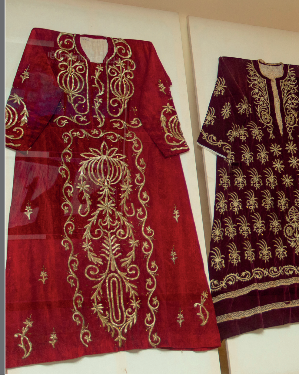
Akhisar Müzesi tek katlı olup Arkeolojik eserler bölümü, Etnografya Bölümü ve Arasta olmak üzere üç ana bölümden oluşmaktadır. Akhisar Müzesi çoğunluğu Akhisar ve yakın çevresine ait eserleri ile siz ziyaretçilerini bekliyor.