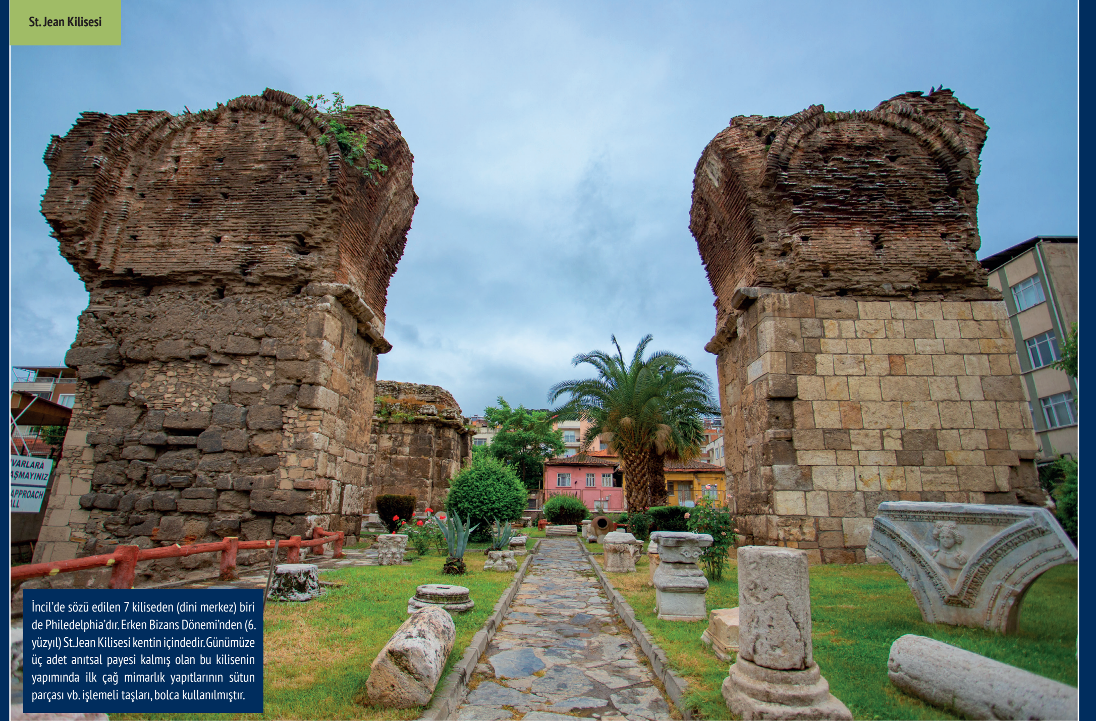
St. Jean Kilisesi

İncil'de sözü edilen 7 kiliseden (dini merkez) biri de Philedelphia'dır. Erken Bizans Dönemi'nden (6. yüzyıl) St. Jean Kilisesi kentin içindedir. Günümüze üç adet anıtsal payesi kalmış olan bu kilisenin yapımında ilk çağ mimarlık yapıtlarının sütun parçası vb. işlemeli taşları, bolca kullanılmıştır.