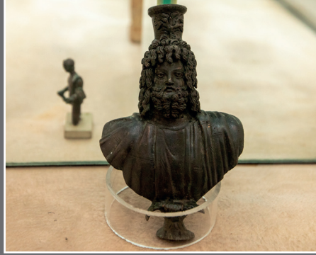
Zeus Serapis Büstü

Bronzdan yapılmış büstün kırık saç ve sakalları bulunmaktadır. Genç bir tanrı olan Serapis her coğrafyada farklı betimlenmiş olup, Anadolu ve Avrupa coğrafyalarında Zeus ile Hades'in birleşimi olarak betimlenmiştir. Bu büste de saç sakal Zeus gibi kabarıktr. Eser Roma Dönemi'ne aittir.