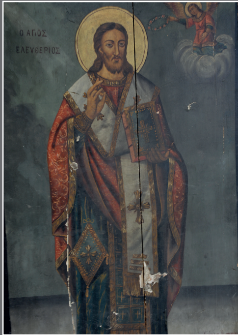
Aziz Eleftherios İkonu

İkon Ortodoks Hristiyanlıkta ermişlerin ahşap üzerine yapılmış resimleridir. Aziz Eleftherios da Ortodoks inananların, çocuk bekleyen annelerin ve doğum yapan kadınların patron azizidir.